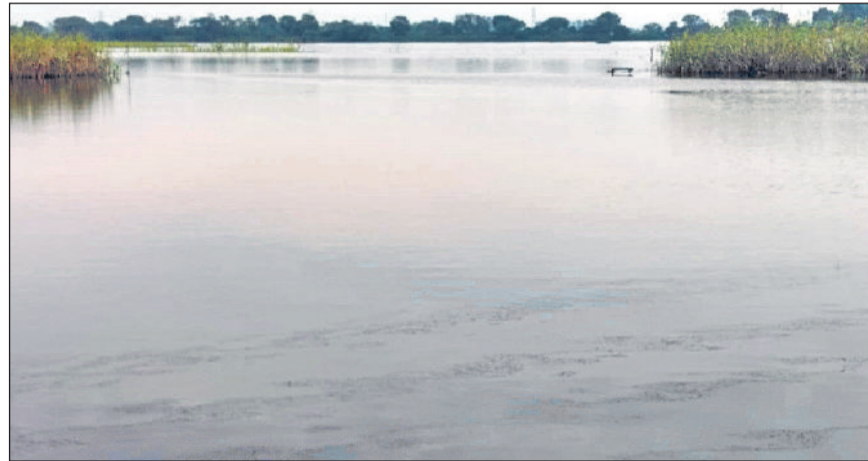
सांपला। गांवों में हुए जलभराव का दृश्य।

लगातार हो रही बारिश से शहर के कई कॉलोनियों सहित सेक्टरों में कई फीट बरसाती पानी जमा हो गया है। लोगों को बाहर निकलने में भी दिक्कत हो रही है। वहीं, कस्बा महम और सांपला के दर्जनों गांवों में बाढ़ जैसे हालात पैदा हो चुके हैं। महम में बाढ़ से निपटने के लिए ग्रामीणों को मिट्टी से बांध बनाने पड़ रहे हैं।