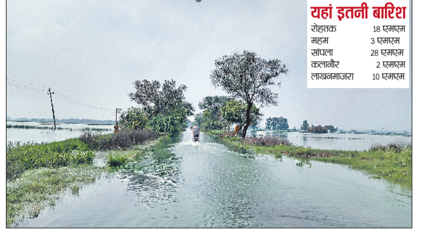
महम की सड़क जलमग्न, यहां से निकलना खतरा से खाली नहीं।