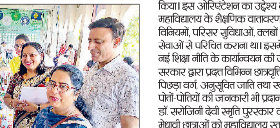
एनवायरनमेंट साइंस एग्जीबिशन का आयोजन