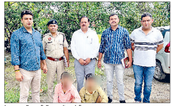
रोहतक। पुलिस की गिरफ्त में आरोपी।